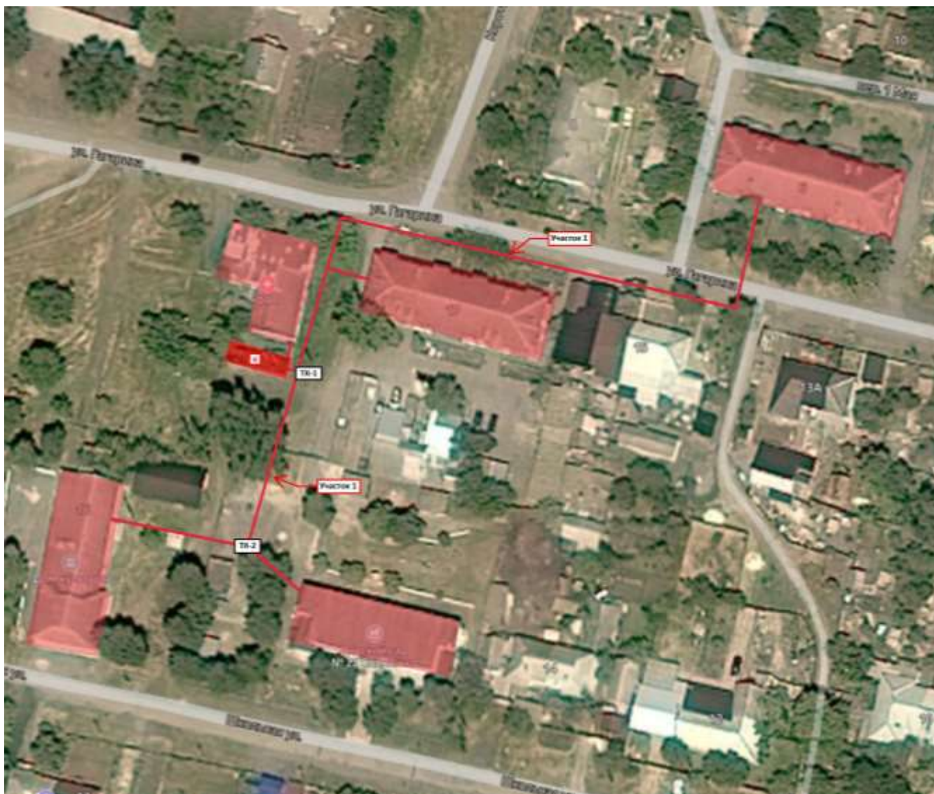
Рис. 1 – Схема тепловых сетей от котельной по адресу: п. Верхнегрушевский, ул. Гагарина, 19а